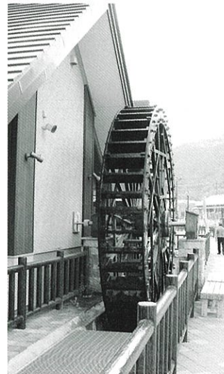
水の郷観光センターの水車。ここからスタートします

⑥ゴールした「ダッパくん」の順位を発表。賞品を水の郷観光センターにてお受け取りください。「ダッパくん」は、マイかっぱとしてお持ち帰りいただき、次回はその「ダッパくん」で、ぜひご出場ください(2回目以降は500円でエントリーできます)。