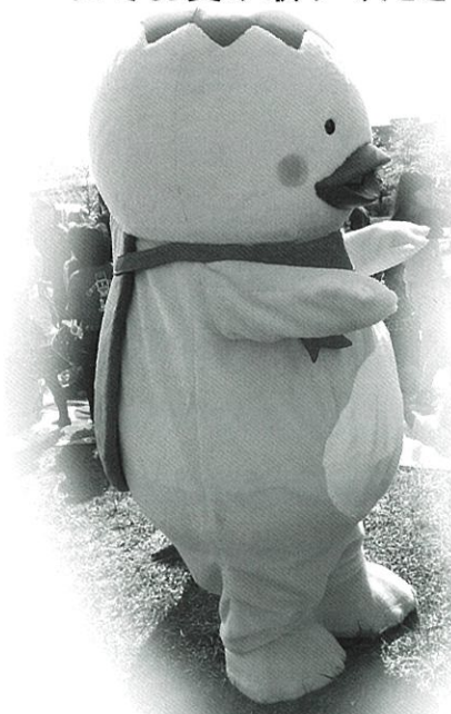
等身大「ダッパくん」も登場するかも？

開催日 予告なく変更する場合があります。 くわしくは☎090-9215-1637までご連絡ください。