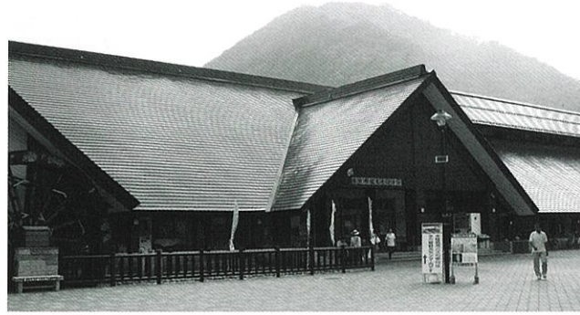
水の郷観光センター

①湯西川水の郷観光センターにて受付(エントリー)します。かっぱのおもち「ダッパくん」と背中に貼るエントリーシールをお受け取りください。