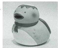
この「ダッパくん」をお持ちの方は500円でエントリーできます

以前にどこかで「ダッパくん」をご購入された方は、お手持ちの「ダッパくん」で出場できます。その場合は500円でエントリーできます。